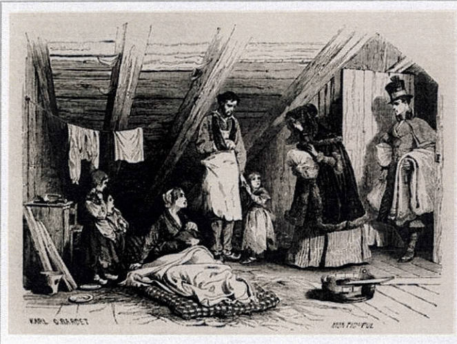
Doc 8 : Un logement ouvrier